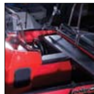
Skreddersydd styrekonsoll med sal.