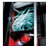
Benk med ekstra lagringsplass.