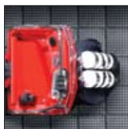
Myk, sklisikker dørk.

Polarcirkel-båtene er laget av polyetylen, et veldig sterkt og fleksibelt materiale som fungerer under alle værforhold.