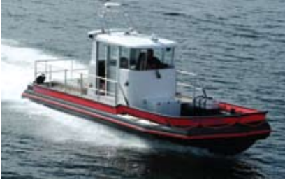
Polarcirkel Hizmet Tekneleri 130hp – 430hp arası gemi içi motorlarla ve 760, 820, 860 cm. 'lik boylarda sunulmaktadır.