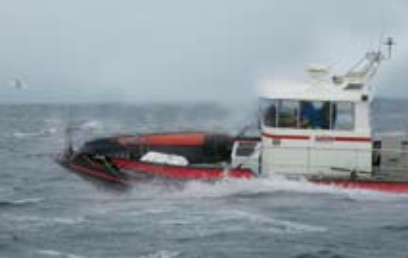
Polarcirkel RIB gövdeleri suyunu kendi boşaltır ve kendilerini hemen hemen batmaz bir tekne haline getiren poliestren dolgulu sert borda borulara sahiptir.